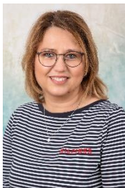
Leitung: Doreen Huntemann